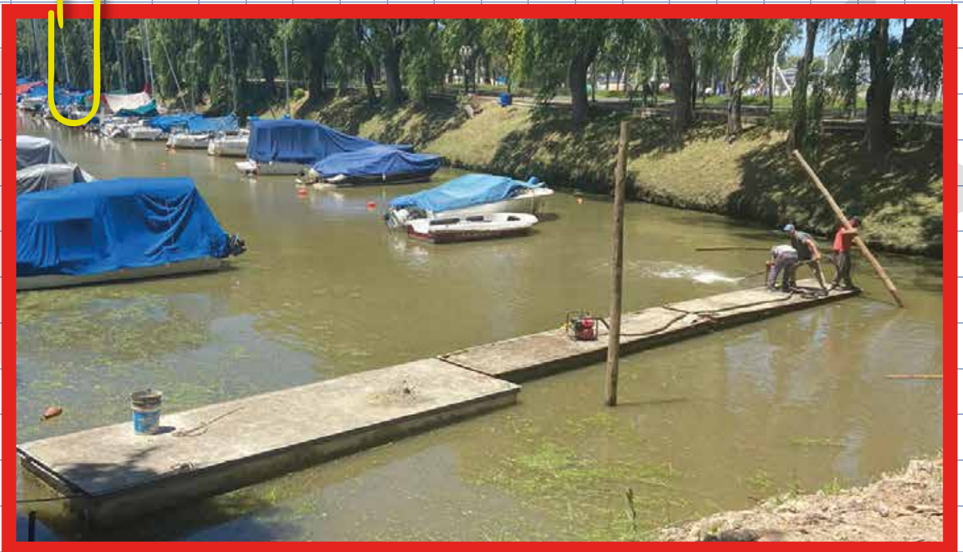
NUEVA MARINA DÁRSENA SUR